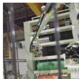
側面に置かれた棚から、指示通りのスリット刃を選択する。