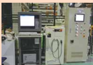
加工指示書データを受け取り、自動刃組装置へ指示を出す機械