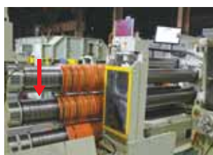
次の刃組をセットするために、機械を下げて高さを合わせる。