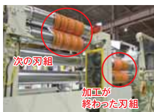
左が次の刃組で、右が加工の終わった刃組。