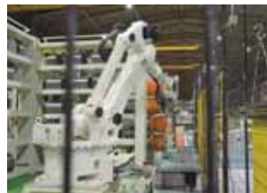
アームで掴んだスリット刃を、指定幅まで差し込む。