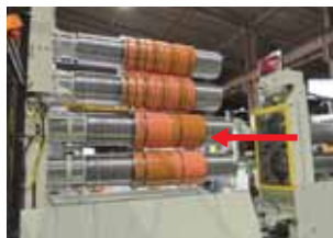
加工が終わった刃組は、右から左へ取り出される。